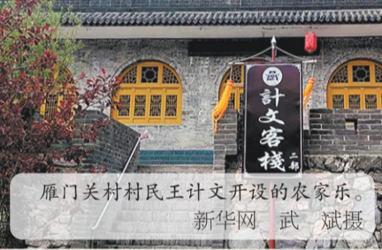
雁门关村民王计文开设的农家乐。