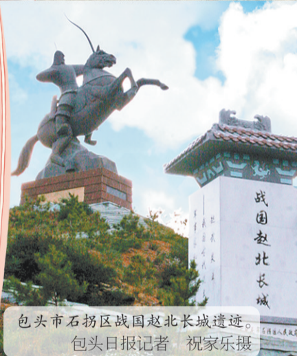
包头市石拐区战国赵北长城遗址。