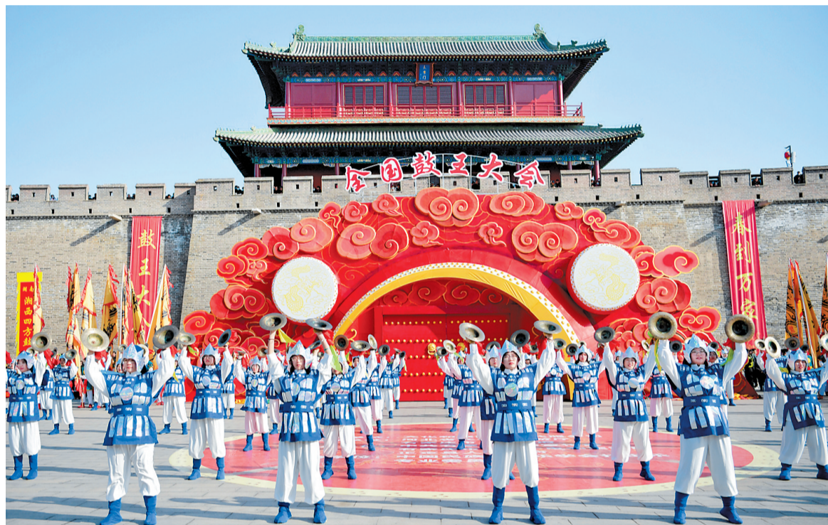
3月9日,正定常山战鼓正在展演。当日,“春到万家——全国鼓王大会”集中展演活动在石家庄市正定古城举办,来自全国的13支优秀鼓乐团队各展其能,为观众奉献振奋人心的“文化大餐”。

现场人山人海,线上也人气爆棚。此次大会进行了全程网络直播,在线观众1200余万人次。集中展演结束后,参演鼓队在正定古城开展了拉街巡游和惠民