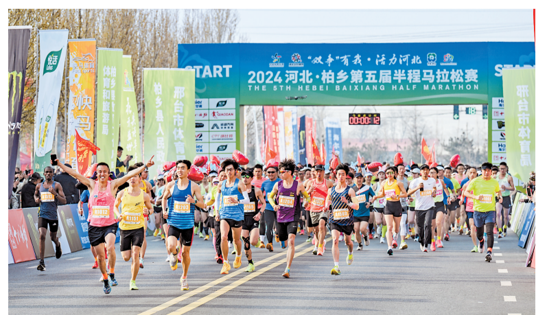
4月6日,参赛选手们在比赛中。当日,2024河北·柏乡第五届半程马拉松赛开跑,1300余名长跑爱好者参加了比赛。