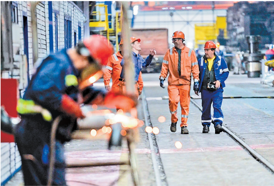
塞尔维亚当地时间4月24日，工人在河钢塞钢车间。