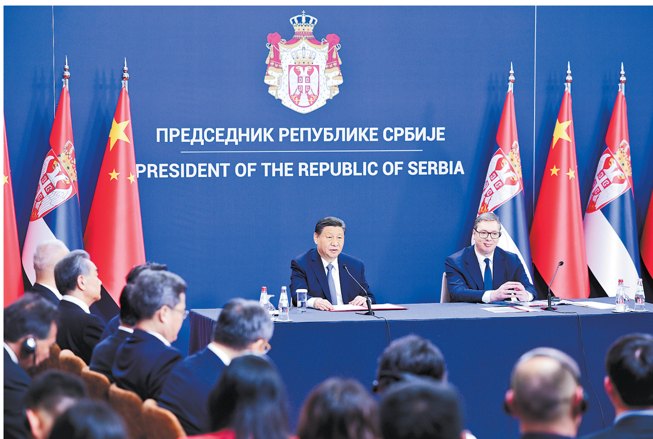
当地时间5月8日中午，国家主席习近平在贝尔格莱德塞尔维亚大厦同塞尔维亚总统武契奇会谈后共同会见记者。